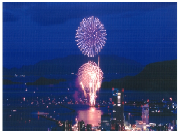
図6 高松花火大会 [4]