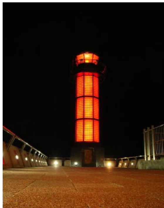
図2 ライトアップされた「せとしるべ」