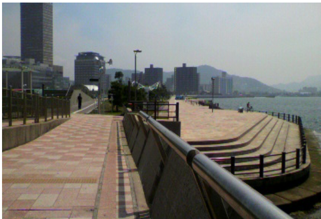
図3 瀬戸内海を眺める人々