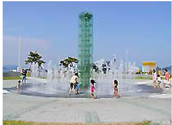
図4 噴水で遊ぶ親子 [3]