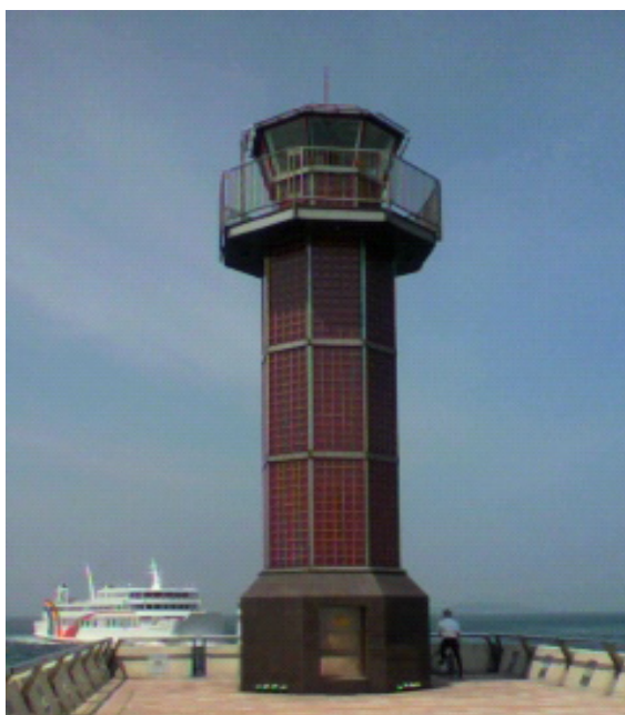
図1 「せとしるべ」とフェリー